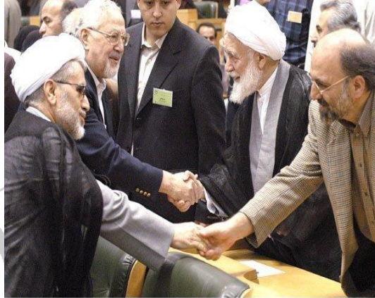
FARS NEWS AGENCY