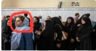
تصویر ۶- حمایت بهنود از انتخابات

اما کوچک تر از اینید. بار دیگر مردم صندوق رای را زنده خواهند کرد.