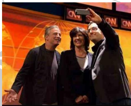
تصویر ۳۷_ بهاری و کریستین امانپور

بهاری در سال ۲۰۱۴ در یک برنامه تلویزیونی با کریستین امانپور نیز حاضر شد. کریستین امانپور مجری cnn از جمله مجریانی است که همواره به عوامل جمهوری اسلامی تریبون می‌دهد و به آنها اجازه می‌دهد که در رسانه‌های غربی مواضع جمهوری اسلامی را تشریح کنند.