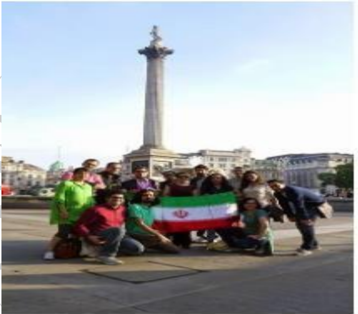
تصویر ۱۱- تیم بی بی سی فارسی