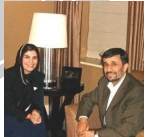
تصویر ۳۹- احمدی نژاد و کاملیا انتخابی فرد

انتخابی فرد یک عکس جنجالی نیز با احمدی نژاد رئیس جمهور پیشین ایران دارد. این عکس همزمان با حضور احمدی نژاد در نیویورک گرفته شده است. گفته می شود که انتخابی فرد با داد و بیداد از اطرافیان احمدی نژاد درخواست ملاقات کرده بود. (۱۰۳)