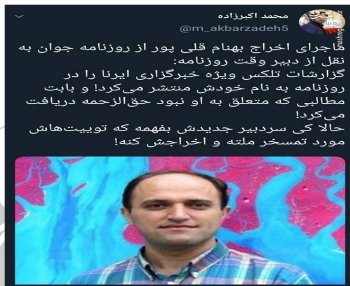
تصویر ۴۰- توییت درباره بهنام قلی پور