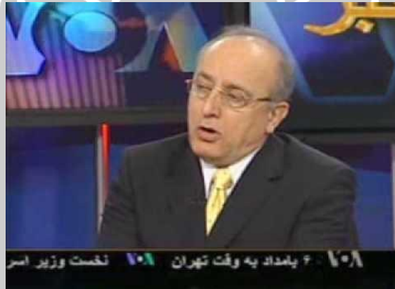
تصویر ۱۵- محسن سازگارا

محسن سازگارا دیگر کارشناس صدای آمریکا است. وی یکی از موسسین سپاه پاسداران بوده است. وی از دانشجویان مقیم آمریکا بود که پس از انقلاب سال ۱۳۵۷ به همراه آیت‌الله خمینی به ایران برگشت. سازگارا در دولت محمدعلی رجایی معاون سیاسی اجتماعی وزیر کشور و مشاور در امور اجرائی بود. (۳۲) او هم اکنون در قامت یک مخالف جمهوری اسلامی ظاهر شده است.